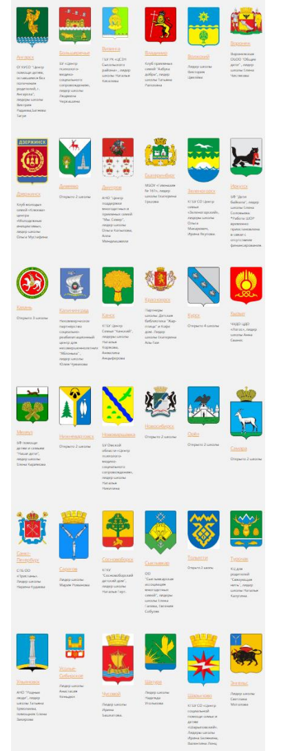
Действующие бесплатные Школы осознанных родителей в регионах